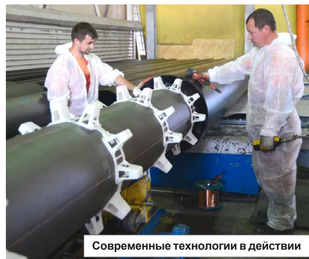
Современные технологии в действии

В ходе посещения предприятия обсуждались возможности предоставления дополнительных заказов предприятию по линии ОАО «Газпром». В ближайшее время у руководства облас-