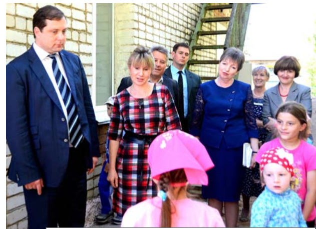
Новоселье обрадовало и детей, и взрослых

В 2014 году в рамках модернизации региональной системы дошкольного образования из федерального бюджета выделено 6 миллионов рублей, а также 569,6 тысячи рублей облас-